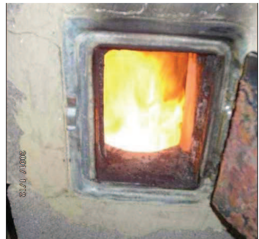
Rußbrand in oberer Reinigungsöffnung erkennbar