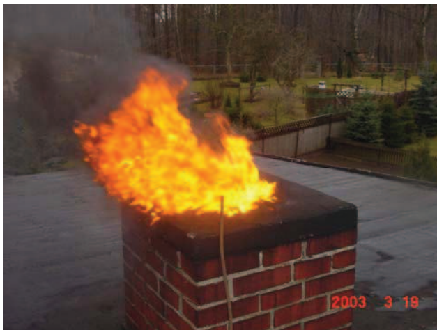
Schmierruß führte zum Brand

Durch die Wiederentdeckung des Brennstoffes Holz, nicht zuletzt auf Grund der steigenden Energiepreise, treten wieder öfter Rußbrände in Schornsteinen auf. In den seltensten Fällen ist eine nicht ordnungsgemäße Reinigung ursächlich. Ganz im Gegenteil, die vorgeschriebenen regelmäßigen Überprüfungen und Reinigungen durch den Schornsteinfeger tragen dazu bei, daß die Anzahl der Rußbrände nicht übermäßig zunimmt. Dies soll jedoch nicht dazu verleiten, diese Brandart weniger zu beachten. Gerade in ländlichen Gebieten und in Altstadtbereichen sind alte Schornsteinkonstruktionen und Feuerstätten keine Seltenheit und deshalb anfälliger für Rußbrände als bei Neubauten. Trotzdem können sie auch bei neuen Feuerungsanlagen entstehen, wenn diese falsch bedient oder mit nicht geeigneten Brennstoffen beheizt werden.